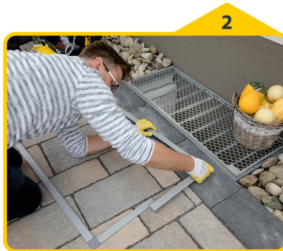
2 Die Profile ineinanderschieben.