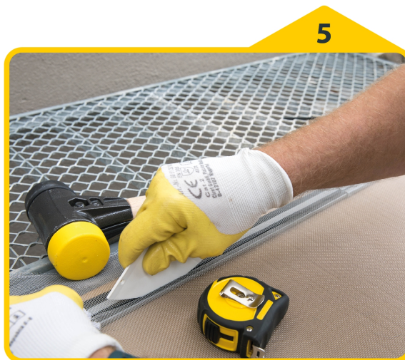
5 Das Gewebe mit der Montagehilfe in die Nut des Rahmens einkedern.