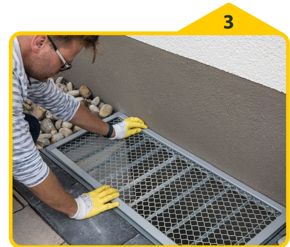
3 Den Rahmen auf das richtige Maß einstellen und mit den Abstandshaltern fixieren.