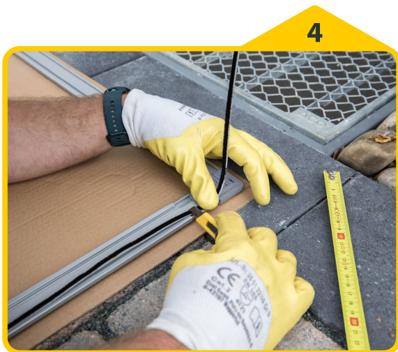
4 Die Bürstendichtung einziehen.