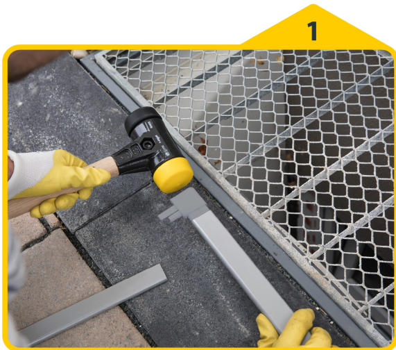
1 Die Eckverbinder mit einem Gummihammer in die Profile einschlagen.